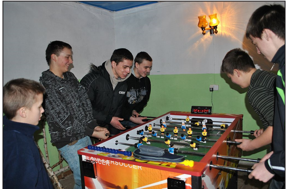
Zacięty bój w piłkarzyki...