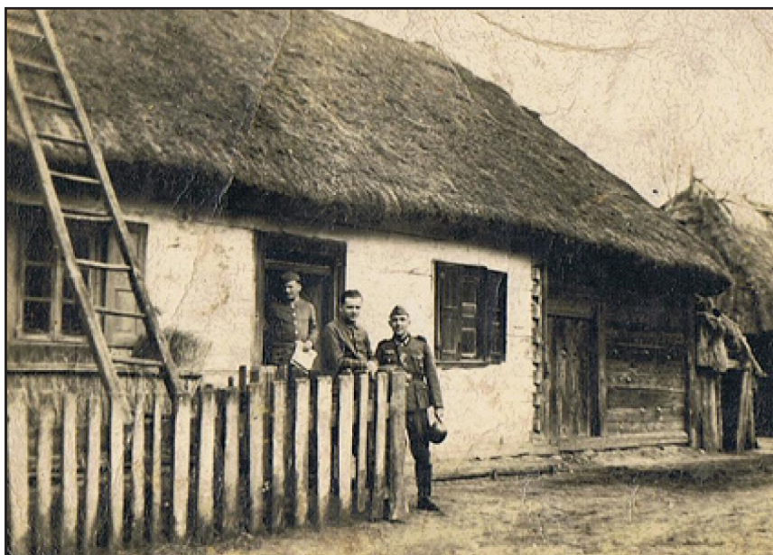
Niemieccy żołnierze przed domem rodziny Sawickich. Studzianka 1941r.