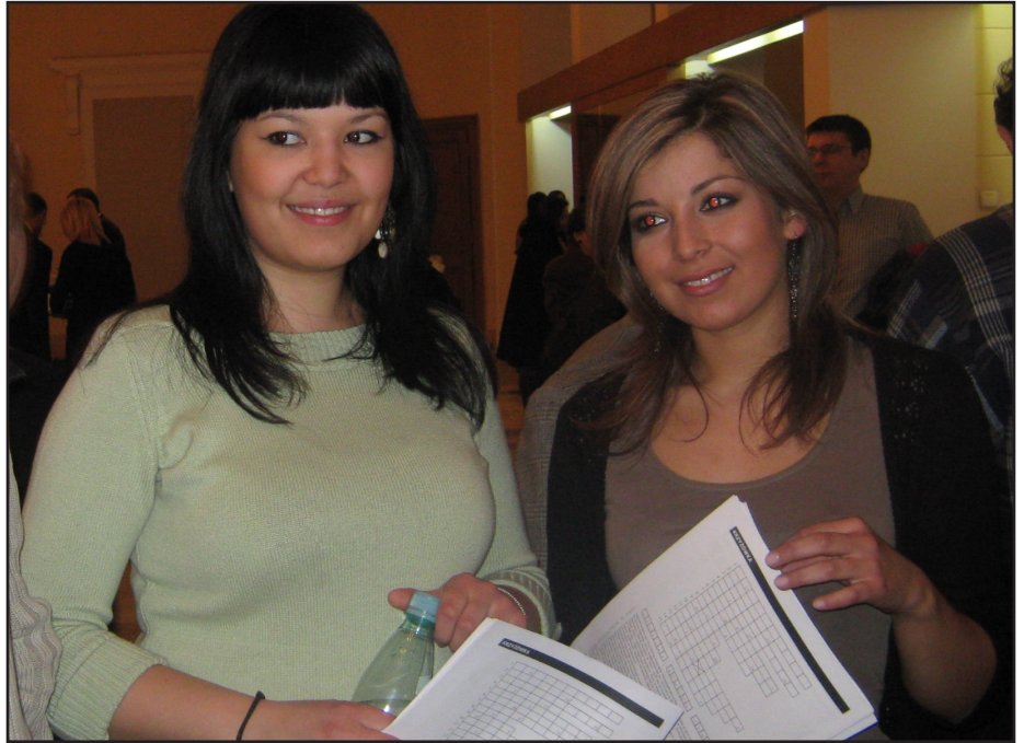
Członkinie zespołu „Buńczuk” z „Echem Studzianki”.