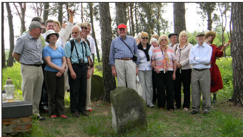
Goście na mizarze.

Dnia 12 maja Studziankę odwiedziła wycieczka Szkotów, która przebywa z 10-dniowym objazdem w naszej części kraju.