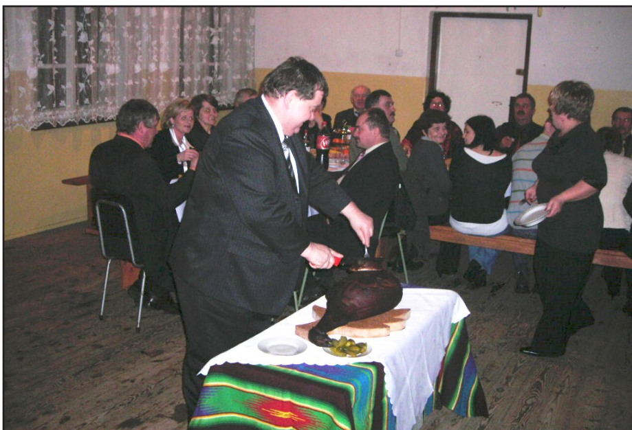
Starosta dzielił wszystkim po równo...