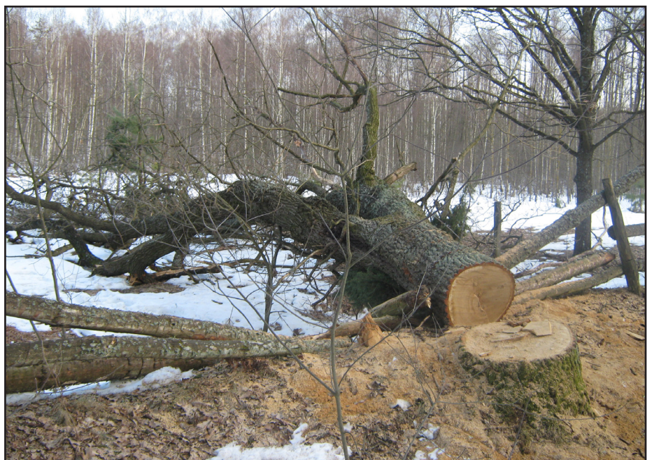
Ścięty dąb leży po dziś dzień na mizarze.