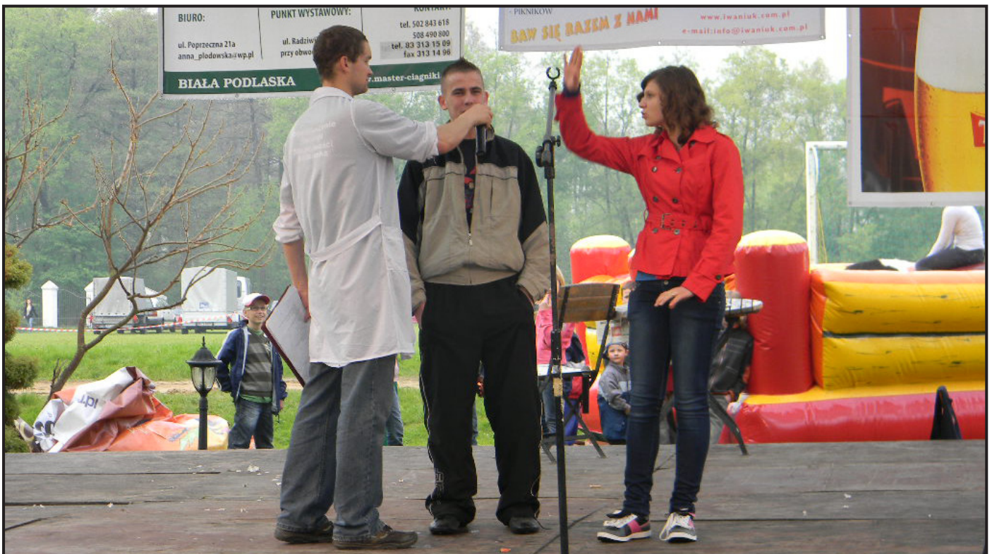
Kabaret „Zielawa” w skeczach „Zero z dziewięciu”.

W końcowej fazie inscenizacji obrońcy zostali wzięci w jasyr, a osada doszczętnie spalona. Rekonstrukcja bardzo podobała się widzowi. Naszym łucznikom pozostał pewien niedosyt, bo chcieliby się dłużej postrzelać. Miejmy nadzieję, że zostanie to nadrobione podczas lipcowej inscenizacji w Studziance.