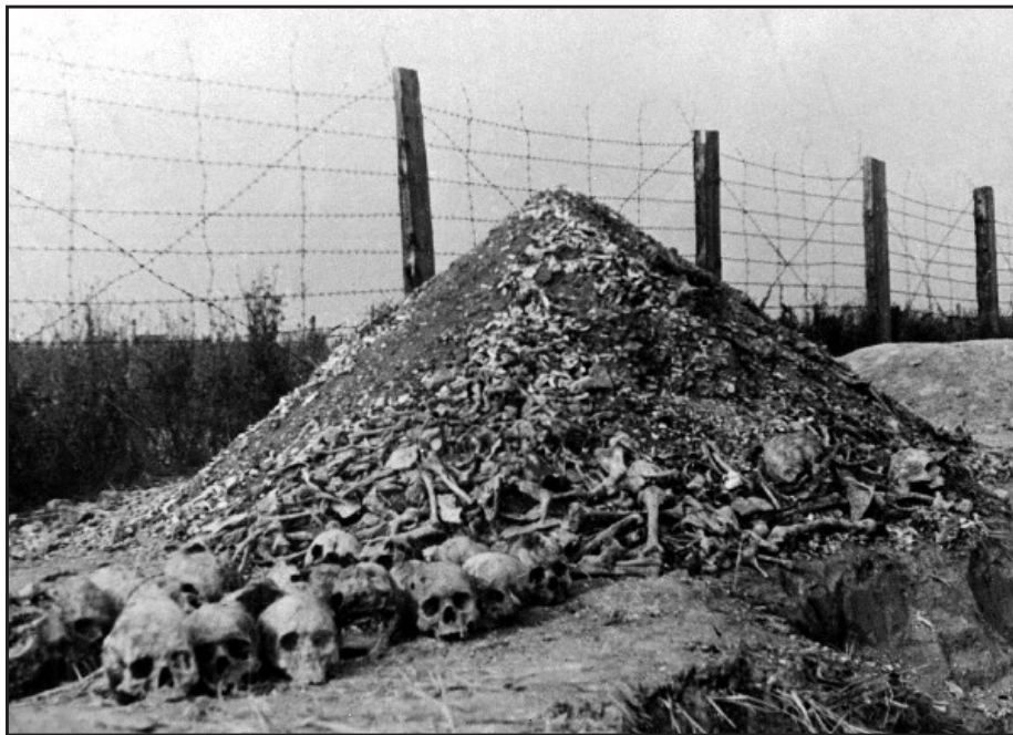
Prochy więźniów spalonych w krematorium na Majdanku.