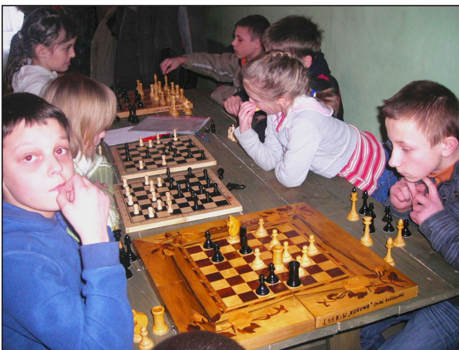
Hmm. Co by w takim przypadku zrobił Kasparow?