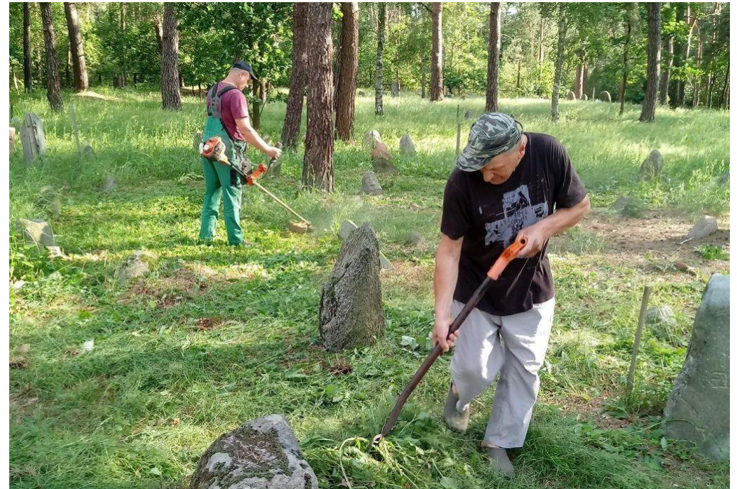
Coroczne sprzątnie tatarskiego mizaru

-25 czerwca mieszkańcy Studzianki a nawet Białan i Białej Podlaskiej czyścili i porządkowali tatarski cmentarz. Ponad 20 osób oczyszczało z zieleń, chaszczki i gałęzi tatarską nekropolię. Działanie jest co roku