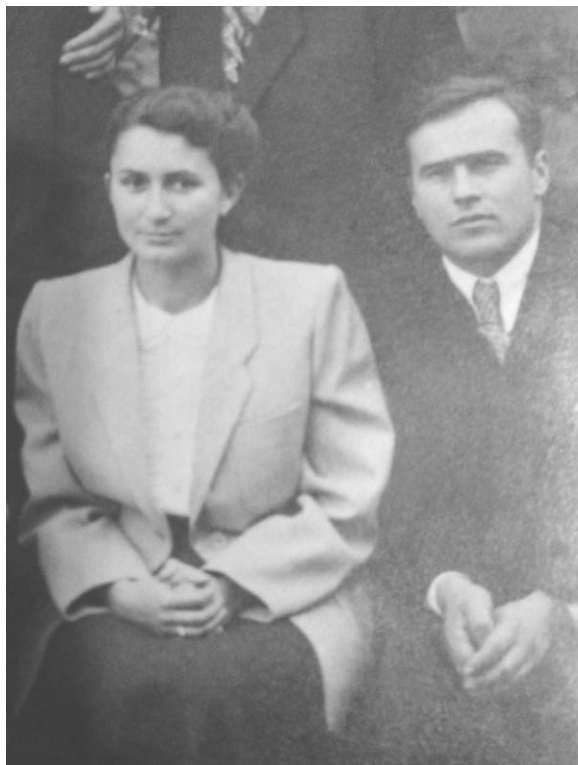
Autor wspomnień z żoną Mrią.

Hitler przygotowywał się do napaści na Związek Radziecki. Gromadził wojska na terenach przygranicznych. Remontował drogi. Między innymi w lesie koło Studzianki skoncentrowane były niemieckie czołgi i artyleria. W naszym domu zakwaterowani byli saperzy niemieccy, którzy remontowali drogi. Byli to przeważnie ludzie starsi. Wśród nich był hitlerowiec, który pilnował porządku i było widoczne, że obawiali się go pozostali żołnierze. Po pewnym czasie opuścili nasz dom a zgromadzone wojska z czołgami odjechały. 22 czerwca 1941 roku w niedzielę około godziny 4 rano Niemcy przekroczyli granice i zaatakowali wojska radzieckie. Było słychać głośny nieustanny huk armat. Trwał on parę godzin i z czasem zaczął cichnąć. W powietrzu wisały balony