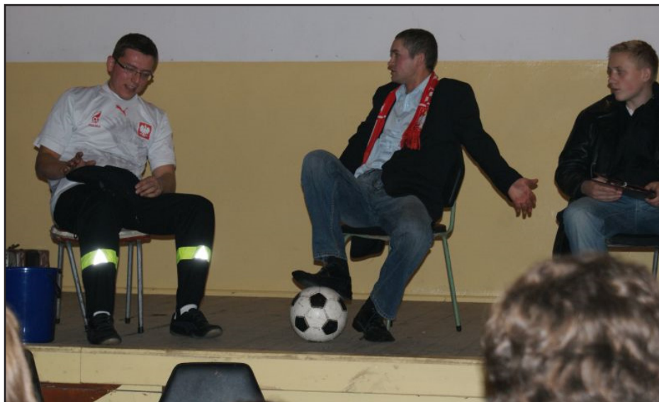
Kabaret „Zielawa” w skeczu pt.: „Wolę zimę w październiku niż lato w PZPN”.

Mieszkańcy Studzianki co najmniej raz w miesiącu spotykają się na wspólnej integracji. Formy tych spotkań są różnorodne.