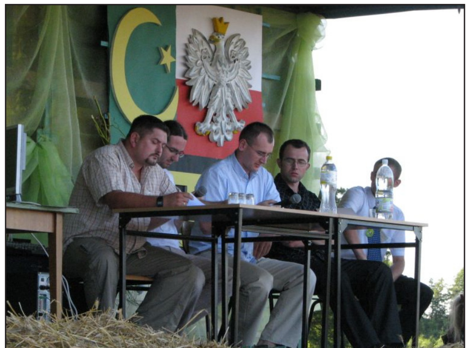
Dyskusja panelowa poświęcona historii i kulturze Tatarów polskich