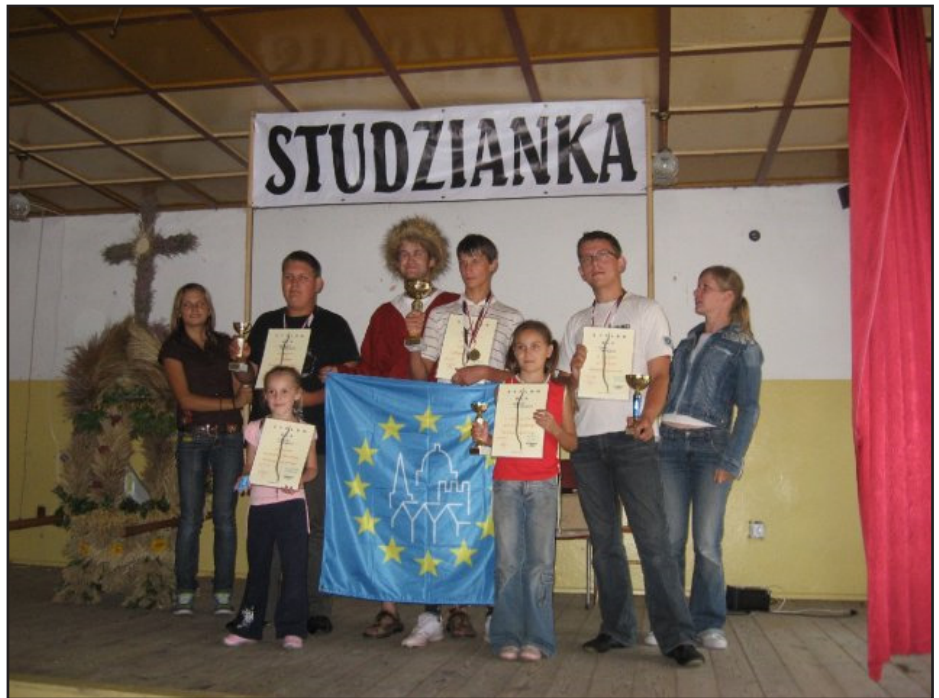
Nagrodzeni z pucharami i dyplomami

W tym roku przypada 240 rocznica bitwy, w której poległ Franciszek Ksawery Pułaski (brat słynnego gen. Kazimierza Pułaskiego). Rajd ten miał na celu przypomnieć i zarazem zwrócić uwagę na potrzebę upamiętnienia tego miejsca, jakże ważnego elementu naszego dziedzictwa. Na tzw. Głuchu jeszcze do II wojny światowej było cmentarzysko poległych konfederatów i Rosjan. Wędrówka na mizar tatarski w Studziance wskazała na ważne miejsce pochówku wielu żołnierzy tatarskich, którzy przelali krew za Polskę w XVIII-XX wieku. Byli wśród nich tatarscy majorowie, kapitanowie, pułkownicy i rotmistrzowie. Drugiego dnia w Studziance odbył się drużynowy quiz wiedzy „Nasza gmina w przeszłości”. Trzyosobowe drużyny zmagaly się z wieloma pytaniami z historii gminy Łomazy i wie-