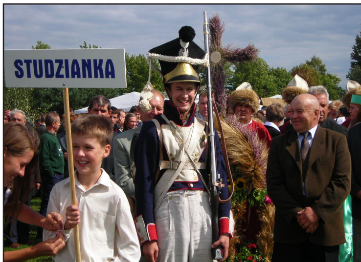
Reprezentanci Studzianki w trakcie prezentacji