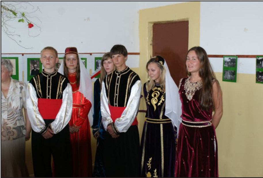
Otwarcie wystawy „Tatarzy na Południowym Podlasiu”.