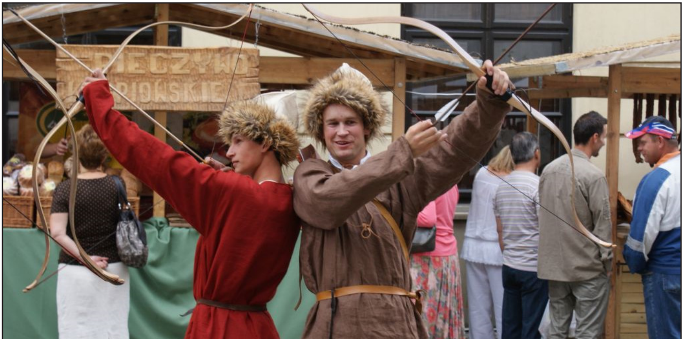
W strojach tatarskich łuczników