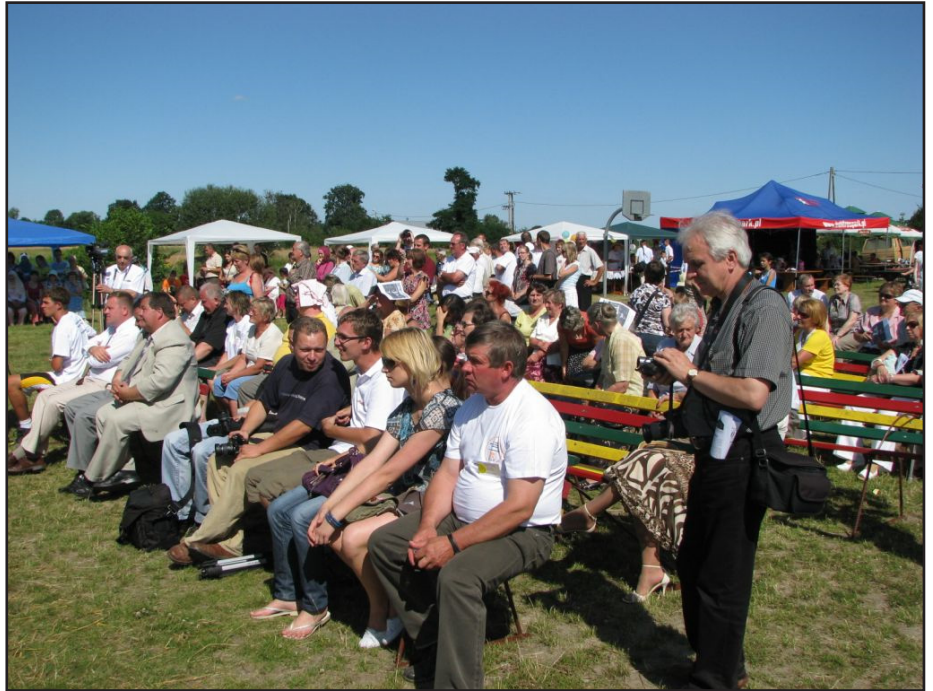
Uczestnicy zjazdu w czasie powitania przez Wójta Gminy Łomazy.