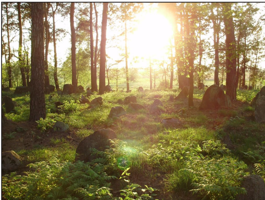
Mizar w Studziance.