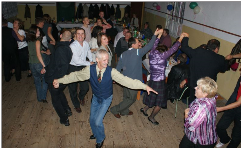
Tańce, hulanki, swawole...