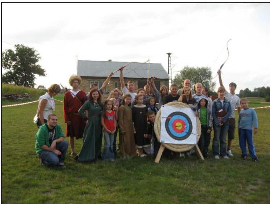
Uczestnicy bawili się wyśmienicie.