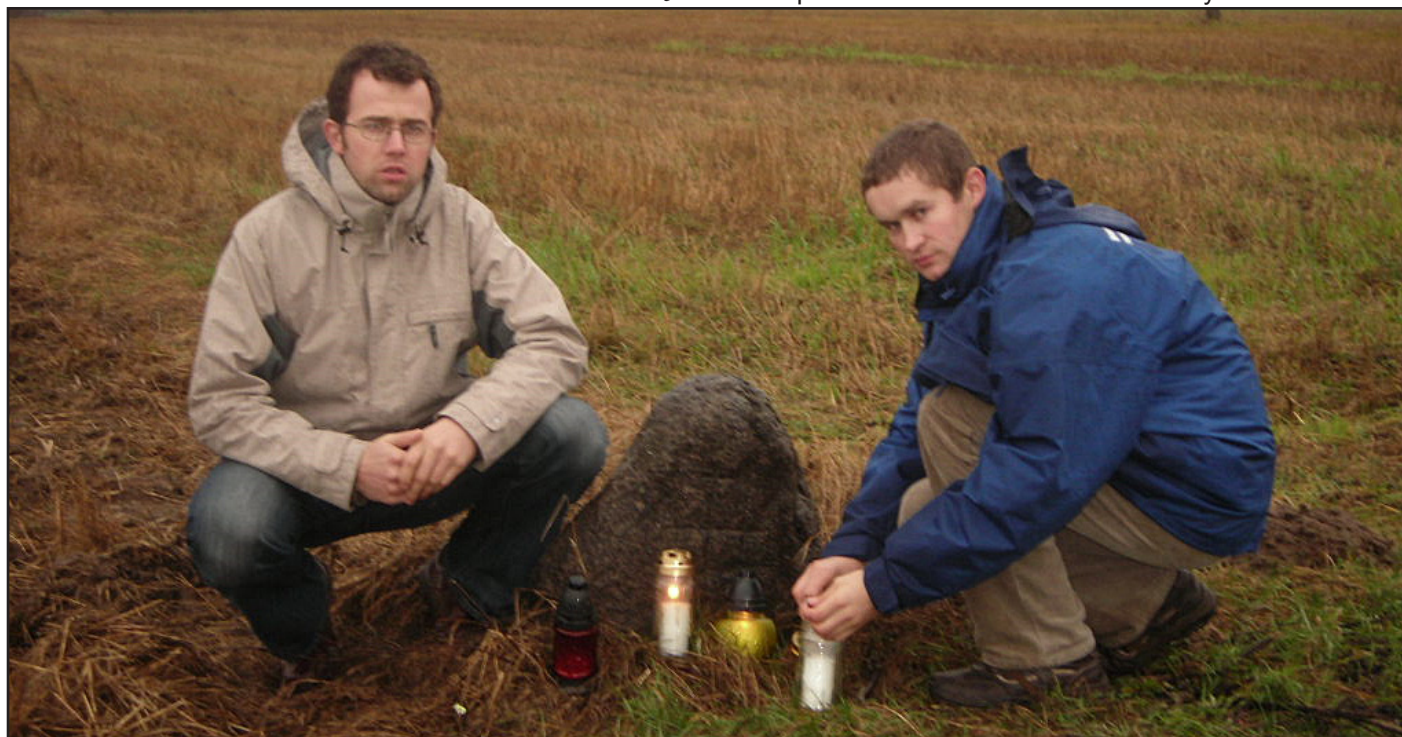
Na „Głuchu” przy symbolicznym kamieniu upamiętniającym śmierć Konfederatów.