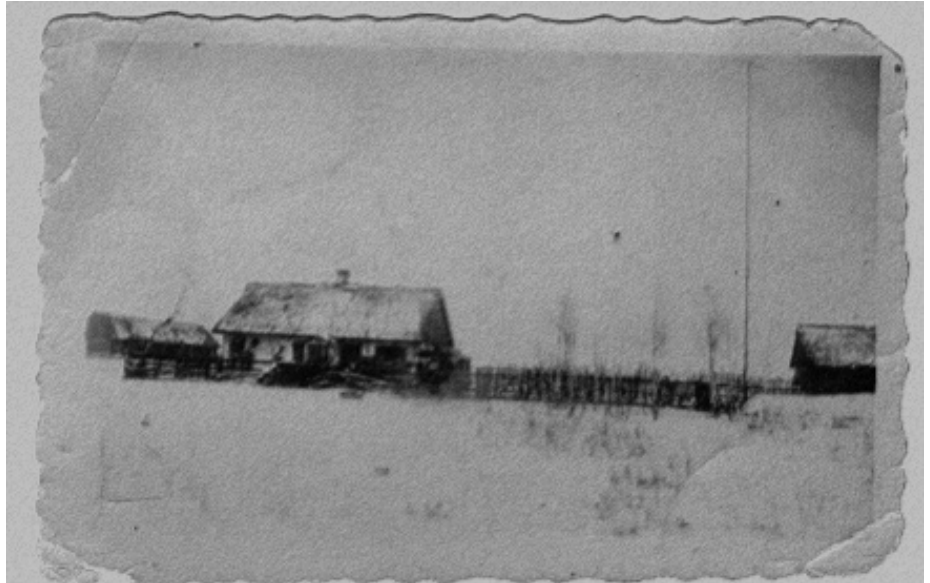
Miejsce, gdzie do 1915 r. stał meczet. Fot. ok. 1935 r.

W okresie powstania listopadowego i styczniowego ludność tatarska Studzianki czynnie walczyła z zaborcą rosyjskim, za co spadły na nią konfiskaty majątku, prześladowania i zsyłki. Wielu z nich w walce o niepodległość Rzeczypospolitej poniosło śmierć. Tatarzy ze Studzianki i okolic służyli w kilku utworzonych wówczas oddziałach, w tym m.in. uformowanym w 1812 roku Szwadronie Tatarskim oraz