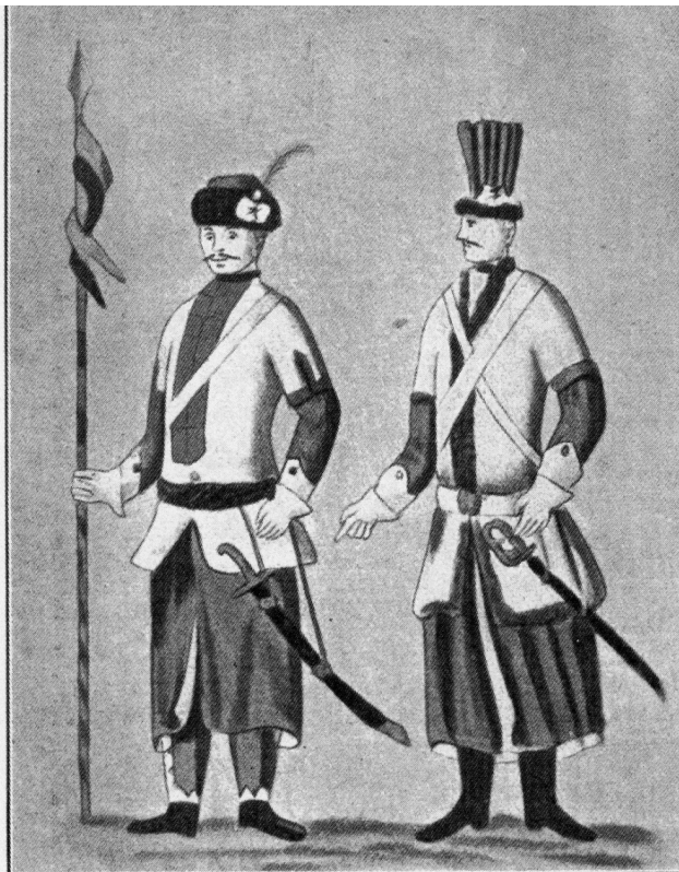
Ułan i pocztowy z pułku gen. Józefa Bielaka, według sztychu z 1781 r.

Tatarzy to lud pochodzenia turkijskiego. Samo słowo Tatar pochodzi prawdopodobnie od słowa „Tartar”, co w języku Tatarów oznaczało wielką ilość.