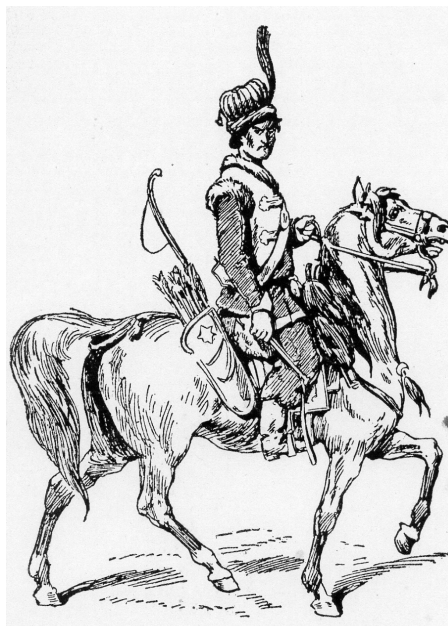
Rotmistrz tatarski. Rycina z XVII w.