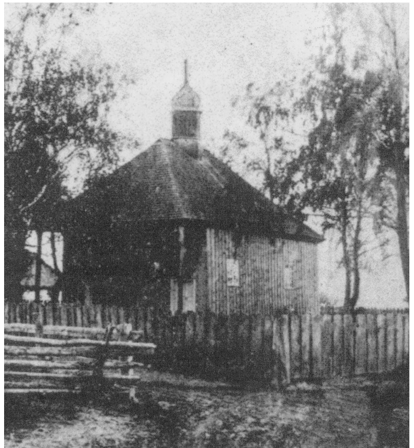
Meczet w Studziance. Fot. ok. 1910 r.