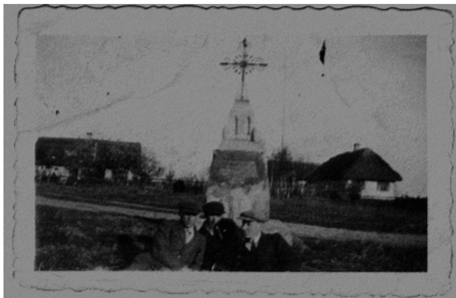
Studzianka, lata 30-te XX wieku.