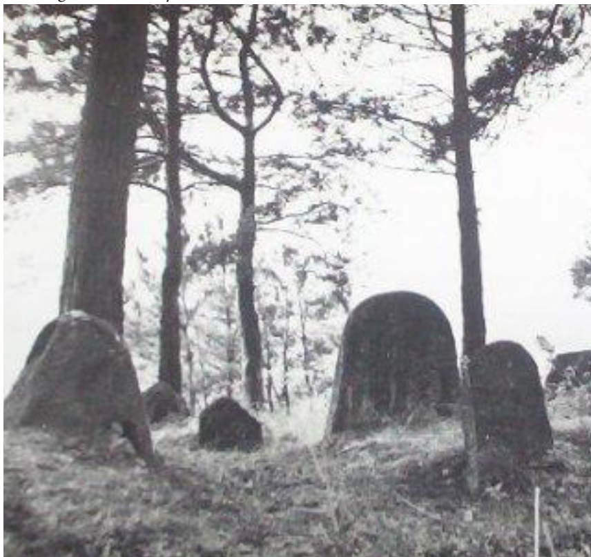
Mizar w Studziance. Fot. z 1967 r. Ze zbiorów Andrzeja Olichwiruka.